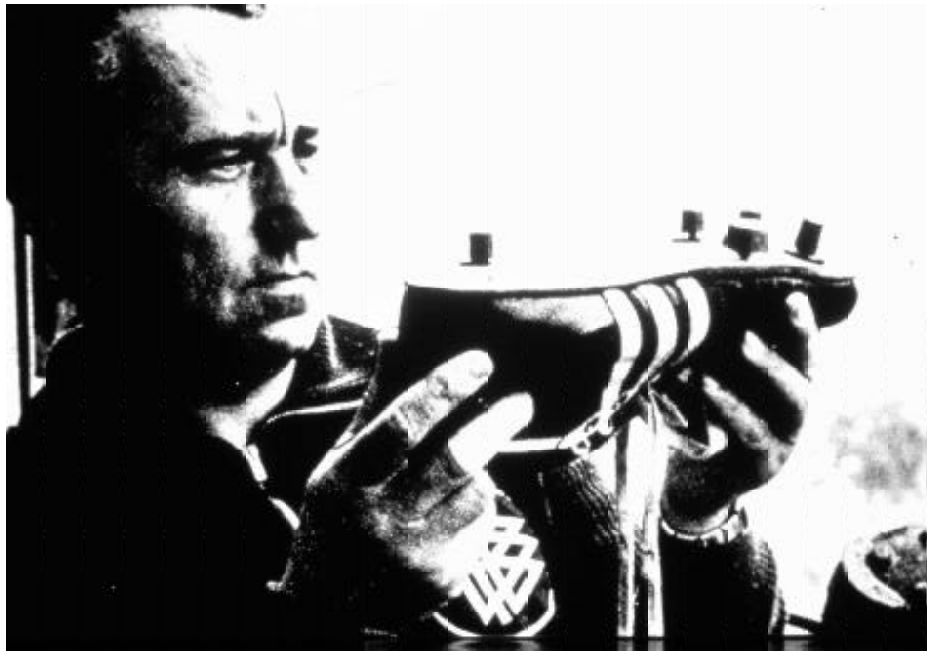
Der „Schuster der Nation“ - immer auf der Suche nach Verbesserungen.

Von 13 Herzogenauracher Schuhfabriken mussten zwei während des Krieges