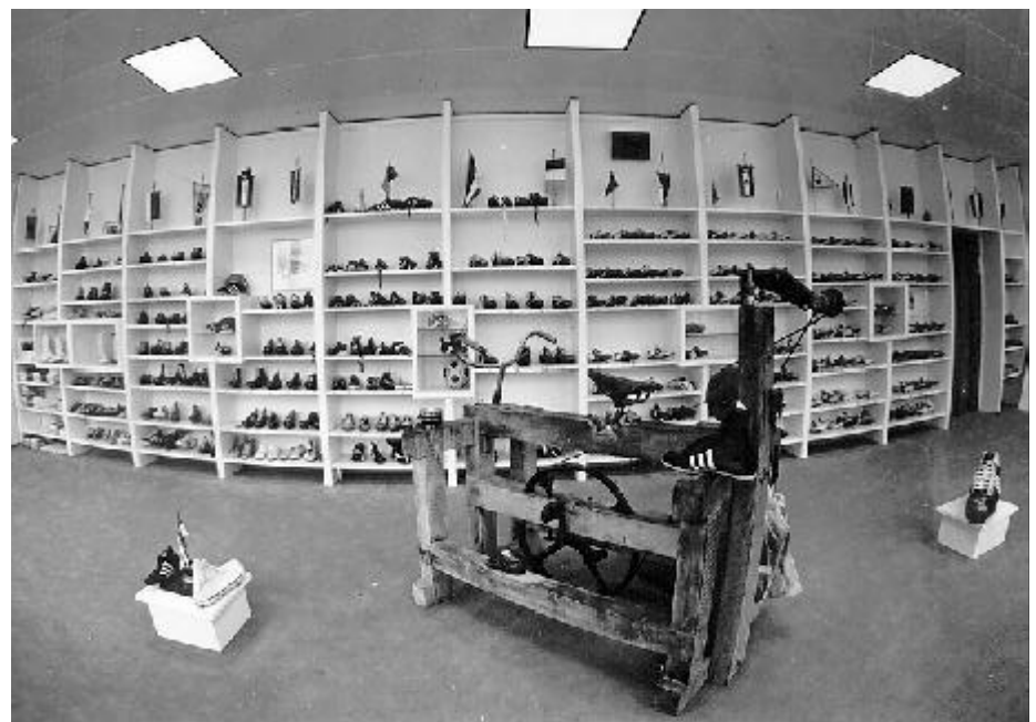
Über 400 Sportschuhe präsentierte das adidas-Sportschuh-Museum. Im Vordergrund ist eine von Adi Dassler selbst entworfene und gebaute Fräse mit „Fahrrad-Pedal-Antrieb“ zu sehen.