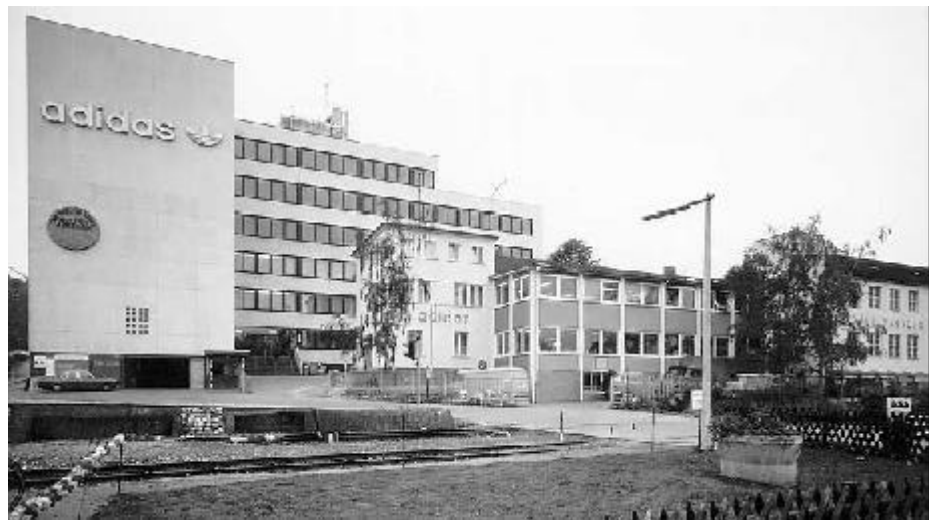
Das Werksgebäude an der Adi-Dassler-Straße. Das „Dreiblatt“ als Symbol für Markenvielfalt machte auch die Stadt Herzogenaurach weltweit bekannt.

genannt wurde, war trotz aller Weltbürgerschaft und Weltoffenheit Herzogenauracher und Franke geblieben. So lange er konnte und immer wenn er Zeit hatte galt sein Augenmerk den Mitarbeitern in der